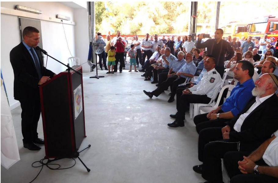
השר גלעד ארזן נואם בטקס חנוכת תחנת הכיבוי של אלקנה, 27.7.2017.