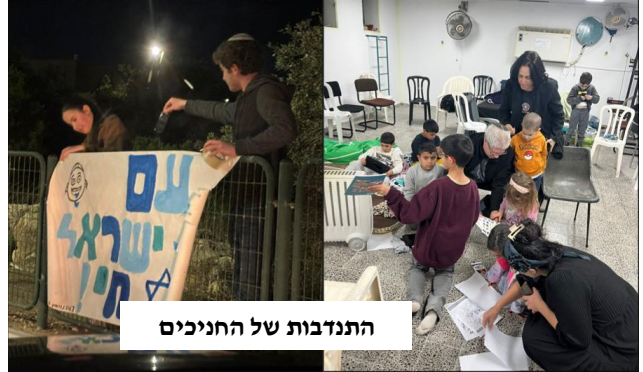
התנדבות של החניכים