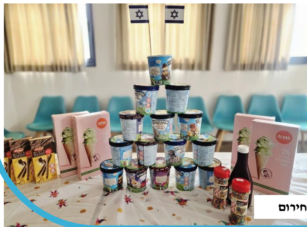
פעילות נוער בחירום