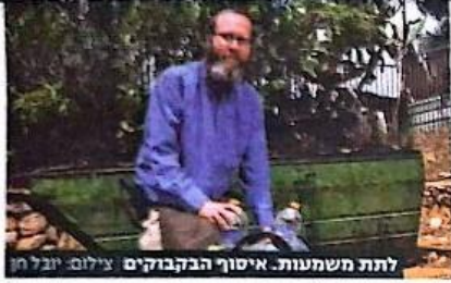
לתת השמעות. איסוף הבקבוקים

רשת הכוללים "תפארת זקנים" פתחה מיזם חדש במטרה להפיג את הברירות של קשישים: בית מדרש באלקנה שמופעל באמצעות מחזור בקבוקים • קהילת הלימוד לקשישים כבר אספה כמיליון בקבוקים, שהצטברו לשווי של 300,000 שקל