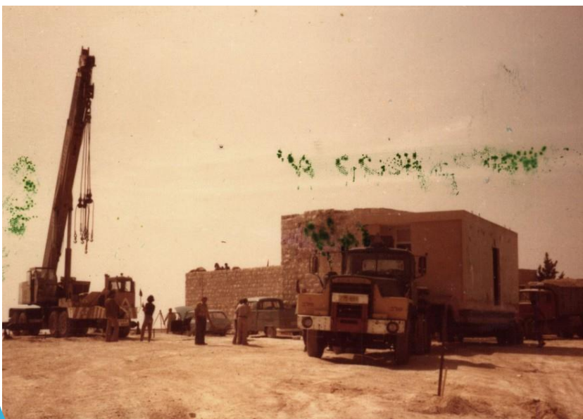
אשקוביות ראשונות מגיעות לפארים

שבוע אח"כ, בכ"ט באייר תשל"ז, 17 במאי 1977, התרחש המהפך הפוליטי הראשון בהיסטוריה של מדינת ישראל. לראשונה הליכוד זכה בבחירות. מפלגת העבודה, ששלטה עד אז עוד מימי ההנהגה הציונית לפני קום המדינה, עברה לראשונה בתולדותיה לספסלי האופוזיציה.