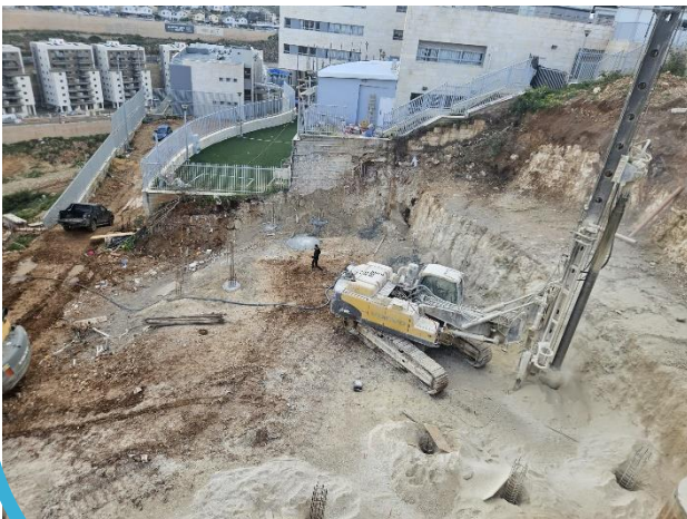
קידוחי יסודות המבנה החדש בישיבת ימ"ה

אנו ממתינים בימים אלו לקבלת אישור להלוואה שאישרה המועצה, ועם קבלתו נוכל להתקדם מול הקבלן לבניית המבנה הנצרך כל כך בשל הביקוש הרב לישיבה המעניקה חינוך איכותי לילדי האזור כולו.