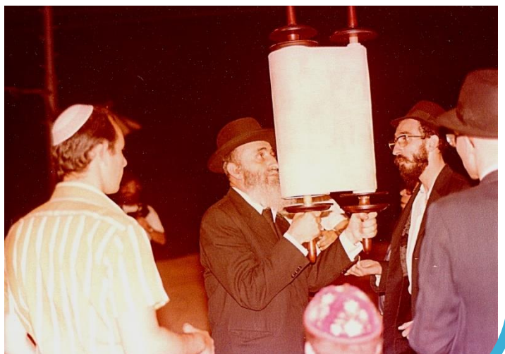
רוקדים עם ספר התורה.