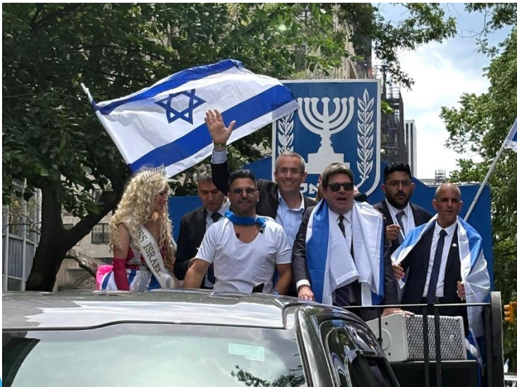
צועדים למען ישראל לצד ראש עיריית ניו יורק לשעבר, הקונסול הכללי ויו"ר הכנסת

תחנה משמעותית נוספת הייתה באירוע של עמותת "שר-אל", שבה אני חבר ושותף פעיל. עמותת שר-אל היא עמותה מופלאה העוסקת בארגון מתנדבים מרחבי העולם לעבודה במסגרת צה"ל. העמותה מביאה מתנדבים יהודים ולא יהודים המועסקים למספר שבועות בסדנאות צה"ל – בדרך כלל בעבודות הקשורות בתחזוקה ובאפסנאות, כאשר מטרת העל של העמותה היא תרומה ישירה לחיזוק המשכיות העם היהודי. השנה, האירוע המרכזי עמד בסימן ציון 50 שנה למבצע אנטבה. האירוע קיבל נפח היסטורי יוצא דופן בזכות השתתפותם של לוחמי סירת מטכ"ל ואנשי מוסד שהיו שותפים פעילים למבצע הנועז. הייתה זו זכות אדירה לשמוע אותם מגלים טפח מתוך מאחורי הקלעים של ההכנות הקדחתניות והביצוע ההירואי ששינה את פני ההיסטוריה.